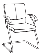
46340 h910 . d610 . w630