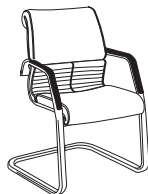
2780 h910 . d690 . w590