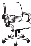
2731 h1030 . d660 . w620