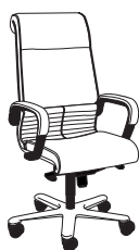
2701 h1260 . d670 . w680

Klassisches Design mit einigen Eigenschaften, die Sitz und Rückenlehne kennzeichnen. Dank seiner schlichten, aber abgerundeten Linien bietet Europa einen hervorragenden Sitzkomfort und eine unglaubliche Ergonomie. Traditionelle Linien, die auch perfekt in ein modernes Ambiente passen.